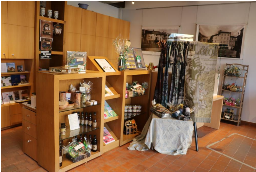
OFFICE DE TOURISME – MAISON DE PAYS (boutique)

Le jeu de société "Circino, le chasseur de trésors - destination Loire" est disponible à l'office de tourisme du Pays de Charlieu-Belmont au prix de 24,95 €.